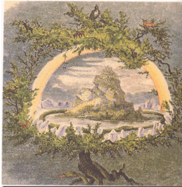
Cây Tam Thế Yggdrasill của Bắc Âu.

-Cây Tam Thế Yggdrasill của Bắc Âu (Nordic).