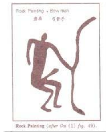
Người bắn cung khắc trên đá.

Cây gậy là nọc, dương (nói chung là vật nhọn, chim, bộ phận sinh dục nam, lửa, mặt trời, núi trụ, trục thế giới...) rất giản dị, điều này không cần phải nói nhiều chúng ta ai cũng đã biết như vậy. Chỉ xin đưa ra một vài ví dụ hình nọc thấy khắc trên đá (petroglyph) cho thấy cái tính chất tối cổ của nguồn gốc chữ viết nòng nọc như: thứ nhất là của thổ dân Úc châu, cây nọc biểu tượng cho đàn ông, hình vòm chuông úp biểu tượng cho đàn bà; thứ hai là hình nọc lồng vào hình chuông úp của thổ dân miền Tây Nam Hoa Kỳ có nghĩa là làm tình, thứ ba là hình người bắn cung cho thấy cây nọc, cây gậy của phái nam được diễn tả tương đương với mũi tên (vật nhọn).